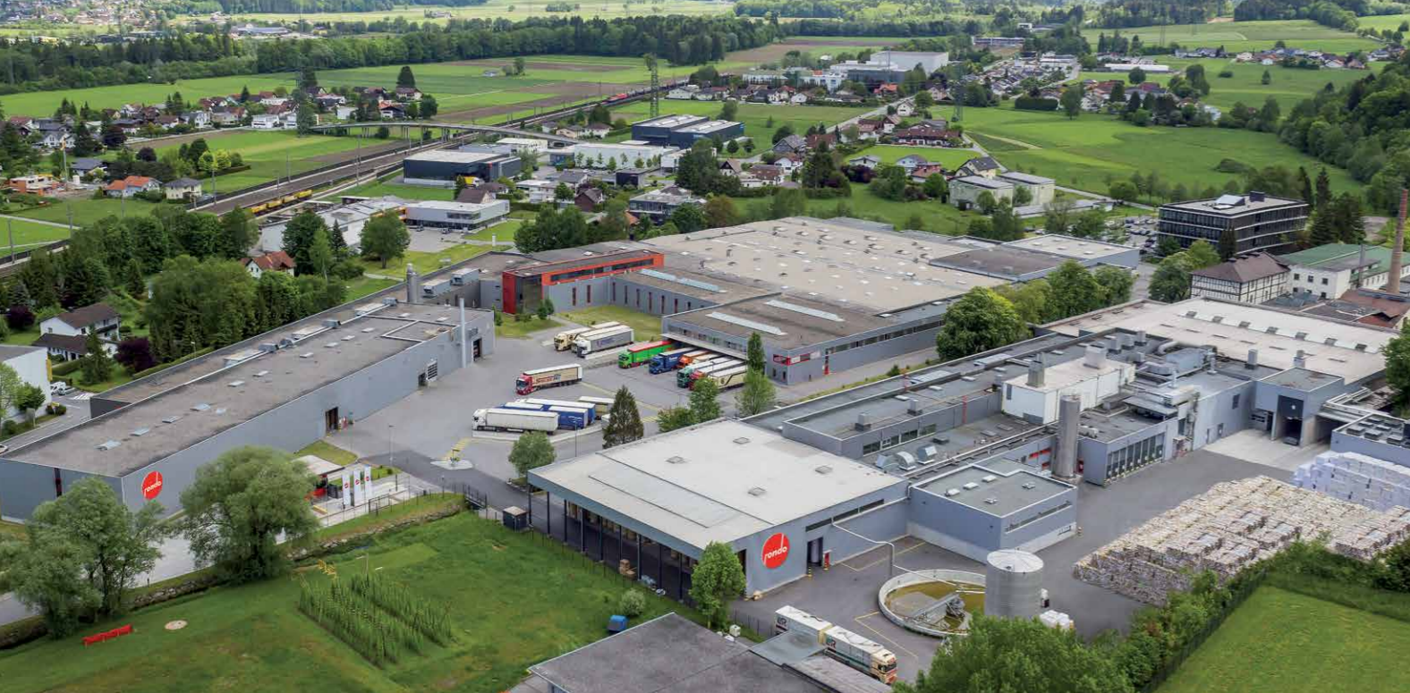
Der Stammsitz der Rondo Ganahl Aktiengesellschaft in Frastanz.