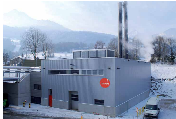
Seit Oktober 2011 sind die beiden Kessel im neuen Kesselhaus bei Rondo in Frastanz in Betrieb.