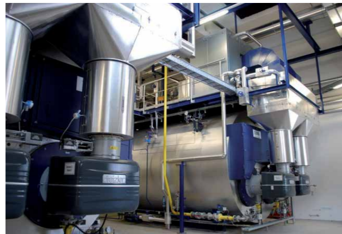
Bis zu 25 Tonnen Dampf werden in jedem Kessel pro Stunde erzeugt.