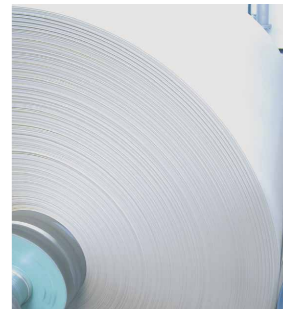
Testliner Edelweiß – das Top-Produkt von Rondo.

Sinnvoll war die Investition für Rondo auch in Anbetracht der geringen Amortisationszeit von nur 3,2 Jahren – bei gleichzeitiger Lebensdauer von zumindest 15 Jahren. Die dafür zusätzlich erforderlichen Investitionskosten für die Anlage zur Verbrennungsluftvorwärmung beliefen sich auf 310.000 Euro. Eine finanzielle Unterstützung in Form von Förderungen wurde keine in Anspruch genommen.